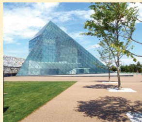
モエレ沼公園 モエレ沼公園管理事務所 TEL.011-790-1231

世界的な彫刻家イサム・ノグチが設計した、「モエレ沼公園」。高さ52mの「モエレ山」など公園全体が雄大な彫刻作品として造られ、訪れる季節や時間によってさまざまな表情を見せてくれます。また、ぜひ味わいたいグルメが、専用の鍋で羊肉を野菜と一緒に焼く「ジンギスカン」。札幌にはさまざまな人気店があります。使う肉やタレの味、またメのうどんやラーメンなど各店の味わい方の個性を楽しみましょう。